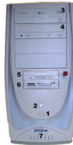
Vista Frontal (Fig. 2)